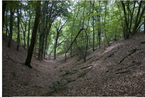
Louisedal bij Berg en Dal, deel van een Romeins aquaduct .