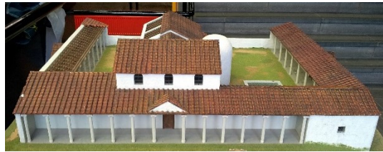
Model van Romeins badhuis in Heerlen

Jaarpaal 90, kubuszijden N1 en N2 Primeur: eerste waterleiding in ons land.