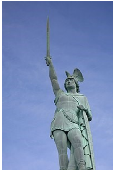
Germaanse aanvoerder Arminius Standbeeld in het Teutenburger Woud (DL)

Reken maar dat die Romeinse soldaten indruk maakten op de bewoners hier. Welke informatie vind je het meest opmerkelijk?