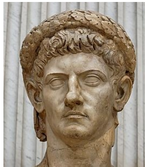
Keizer Claudius (Wikipedia)

Jaarpaal 40, kubuszijde N Hoog bezoek maar met een sneu resultaat.