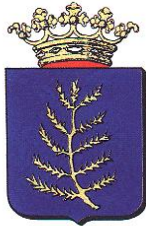
Stadswapen van Rijssen.

Graaf Otto III was bisschop van Utrecht. Hij verleende op 5 mei 1243 stadsrechten aan Rijssen. Daarmee bezorgde hij zichzelf, als hij van Utrecht naar bijvoorbeeld Oldenzaal reisde, een veilige verblijfplaats omdat Rijssen in die tijd omringd was door moerassen.