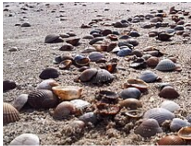
Voor het oprapen...

Jaarpaal 34, kubuszijden N1 en N2 De Romeinen introduceren hier een nieuw type bouw.