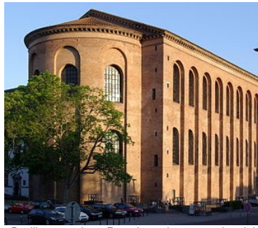
Basilica: openbaar Romeins gebouw voor handel en rechtspraak (Afbeelding: Wikipedia)

Jaarpaal 34, kubuszijden N1 en N2 De Romeinen introduceren hier een nieuw type bouw.