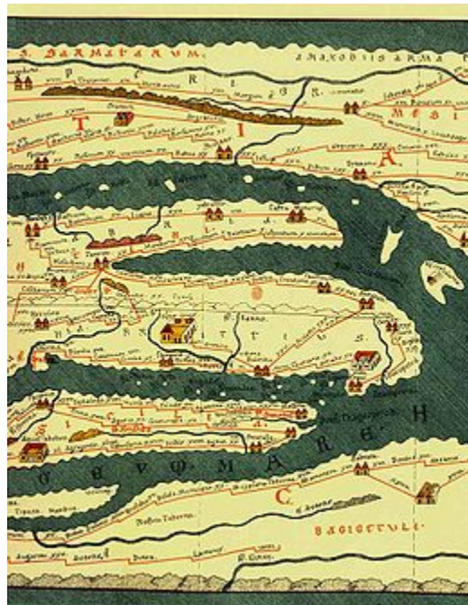
Fragment van Peutinger wegenkaart uit Romeinse tijd

Jaarpaal 102, kubuszijden N1 en N2 Surprise! Badplaats Nijmegen.