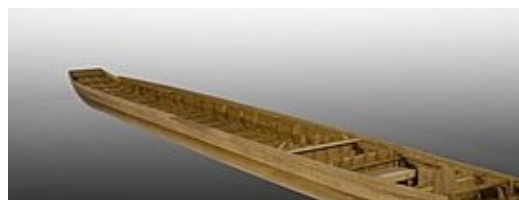
Model van Romeins schip dat bij De Meern (U) is opgegraven (Museum Castellum Hoge Woerd)

Romeinse legioenen bleken niet onoverwinnelijk. Dat geldt ook voor machtige legers in onze tijd. Waar denk je aan?