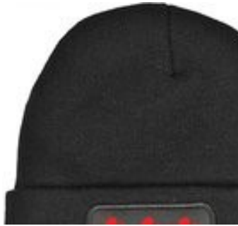
Fryslân boppe, leve Friesland! (afbeelding Bol.com)

Keizer Claudius richt een soort 'waterlinie' in. Verschil en overeenkomst met de waterlinie die we later zelf aanlegden?