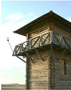
Reconstructie van een Romeinse wachttoren bij fort Fectio