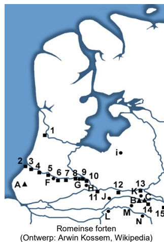
Romeinse forten (Ontwerp: Arwin Kossem, Wikipedia)

Jaarpaal 43, kubuszijden N en E Nieuwe keizer, nieuwe kansen. Succes dankzij 'Nederlandse mariniers'.