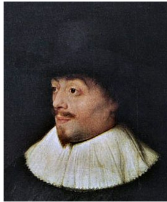
(Portret door Jan Lievens (1627-1630).

Vernoemd naar Constantijn Huygens (1596-1687), een van de grootste Nederlandse dichters uit de Gouden Eeuw, diplomaat, secretaris van o.a. Frederik Hendrik, geleerde, componist, architect en talenwonder. Met andere woorden: een alleskunner. Vader van staatsman en natuurkundige Constantijn Huygens jr. en van de geniale natuur- en wiskundige Christiaan Huygens. Naamgever van de Constantijn Huygensprijs voor literatuur.