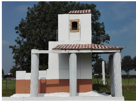
Model van Romeinse tempel in Empel (Christomartens, afbeelding Wikipedia)